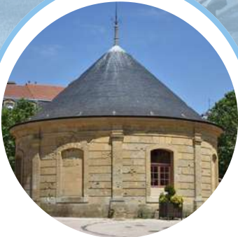
LE PUIITS DE SIÈGE