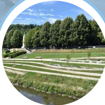
LE PARC DES RÉCOLLETS