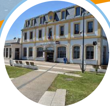
LA GARE SNCF